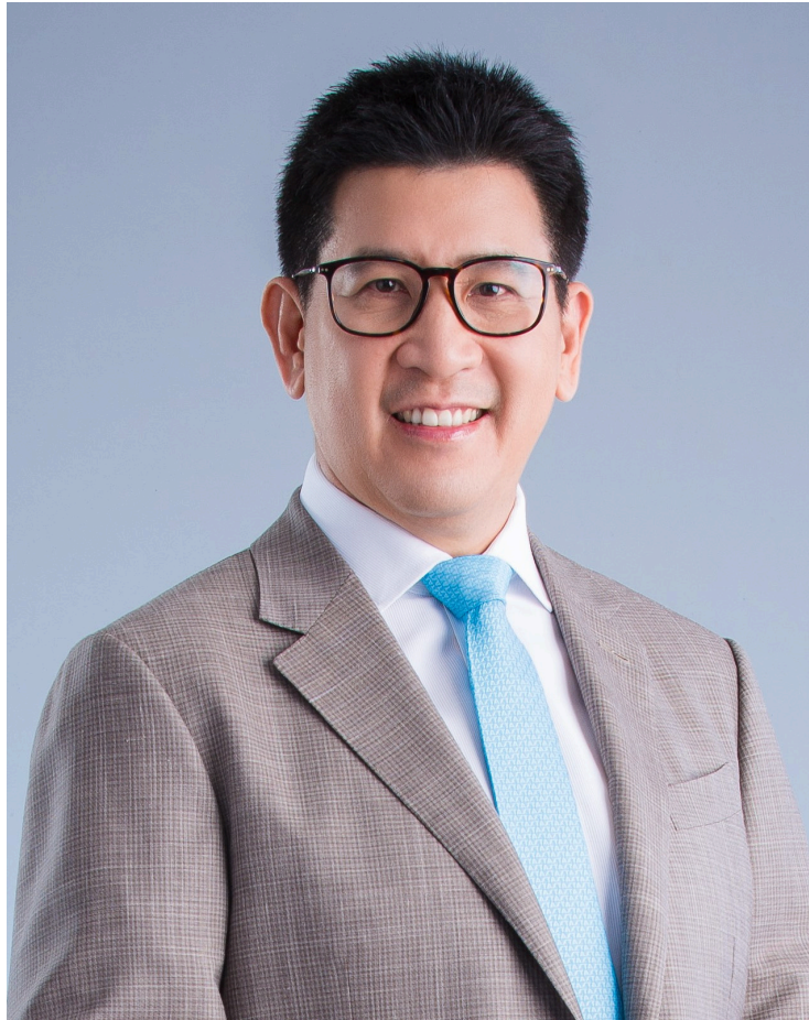
นายเอกนิติ นิติทัณฑ์ประภาศ รองนายกรัฐมนตรี และรัฐมนตรีว่าการกระทรวงการคลัง